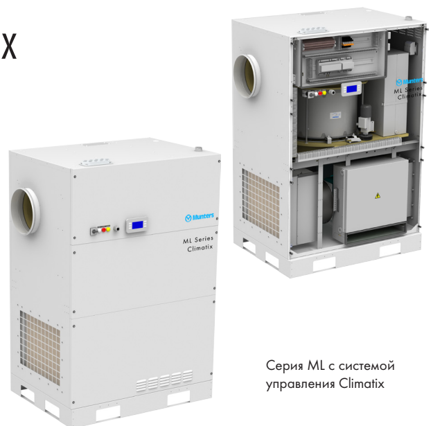
Серия ML с системой управления Climatix

Munters, Air Treatment Division, www.munters.com