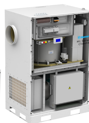
Серия ML с системой управления Climatix