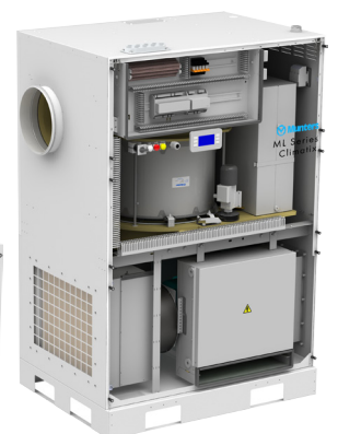
Серия ML с системой управления Climatix