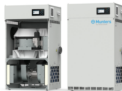
ML420 с Munters AirC

Данная технология – это результат 60 лет инноваций и прикладных знаний в области идеального контроля процесса осушения.